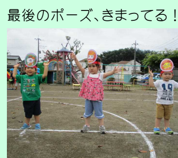
最後のポーズ、きまってる!