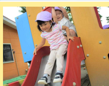
すべりだい、楽しい♪