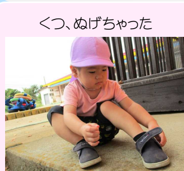
くつ、ぬげちゃった