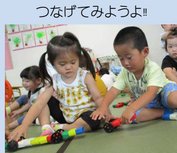
つなげてみようよ!!