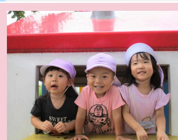
いらっしゃいませ~