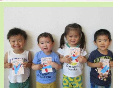
じいじ・ばあば、大好き!