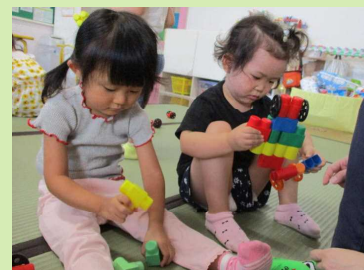
ふたりとも真剣です